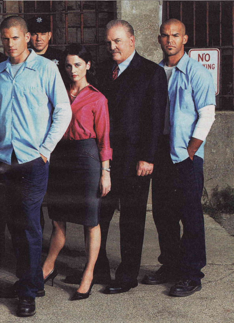
Podobně jako Ztraceni nebo 24 hodin se i seriál Útěk z vězení stal kultovním. A z původně méně známých herců se stávají populární hvězdy.

O Magazínu DNES se dočtete na stránkách prison-break.cz